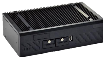
産業用組込みPC EC4Aシリーズ