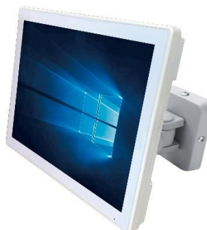
VESA取付パネルPC AS4Aシリーズ