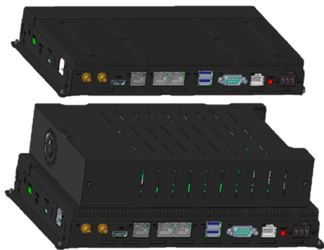
拡張搭載モデル※イメージ図