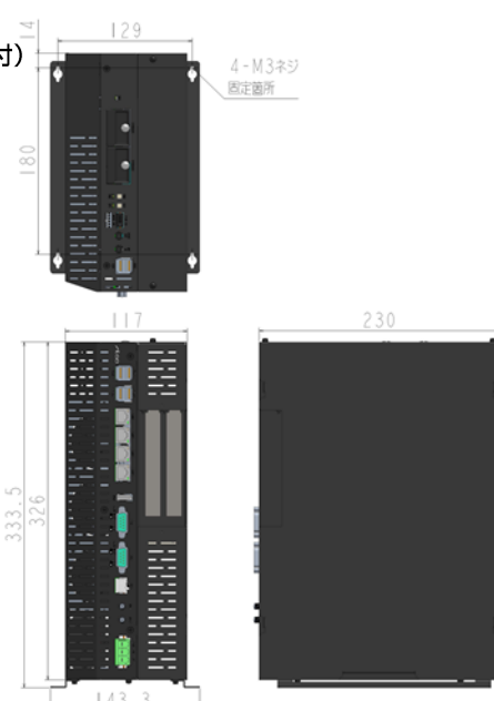
※図は無線LAN、LTEオプション搭載品です。 ファン搭載モデルとファン非搭載モデルでは筐体のスリット数が異なります。