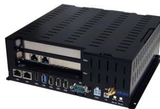
産業用コントローラ C-EC1G-021BT