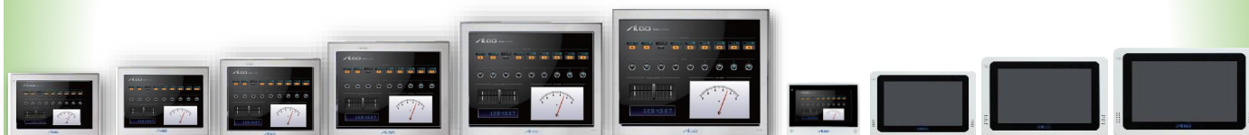
APS1Aシリーズ (7インチ~17インチ)