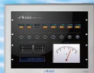
APS1A-121AN 12.1 inch