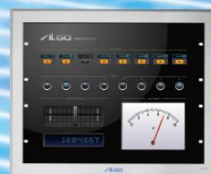
APS1A-150AN 15.0 inch