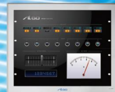
APS1A-170AN 17.0 inch