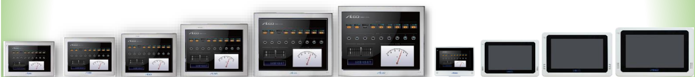
APS1Aシリーズ (7インチ~17インチ)